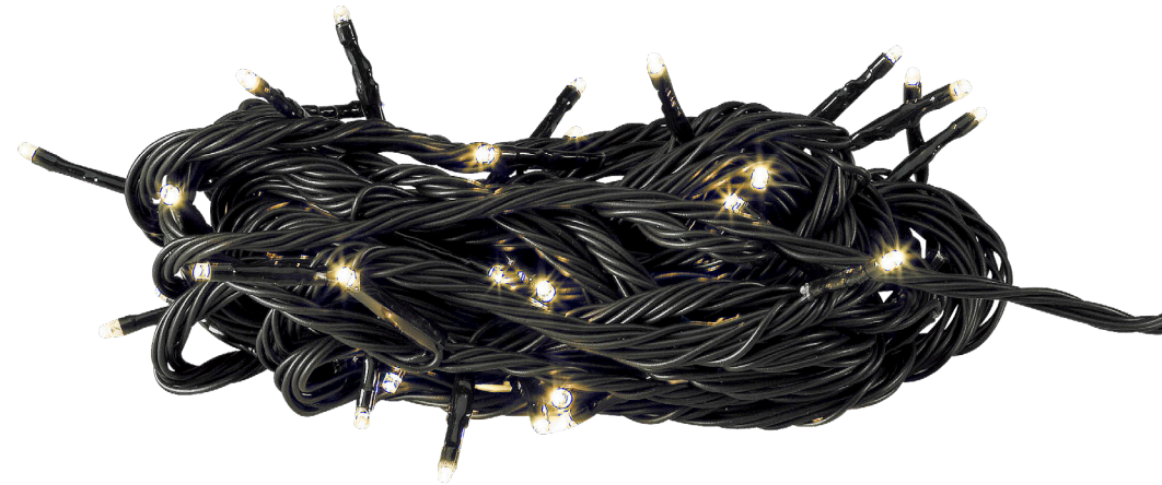
10m 100x LED Warm White 2W