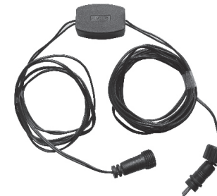
AC/DC Converter (7513011)